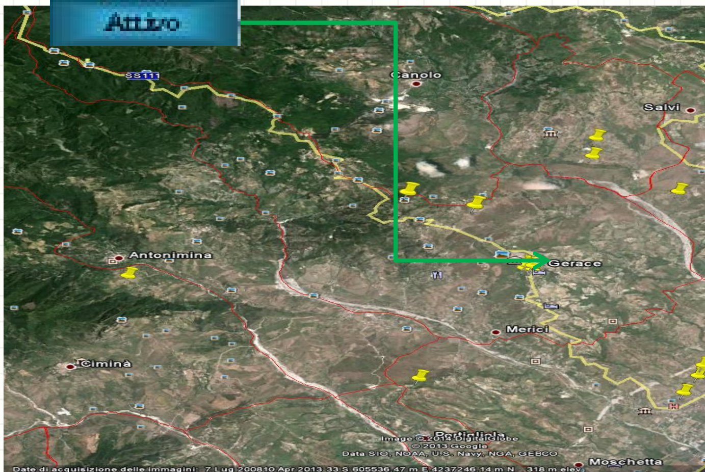
Comune di Gerace Ubicazione sorgenti CEM radiofrequenza nel territorio comunale