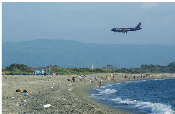
Il golfo di Sant'Eufemia. Un divieto di balneazione è posto nei pressi dell'aeroporto

È difficile prevedere, stigmatizza il geologo, «se l'eccellente qualità delle acque marine documentata in tutte le analisi effettuate nel corso delle due ultime stagioni balneari e nei mesi scorsi sarà confermata anche nei prossimi mesi più caldi dell'estate». Se continuerà la tendenza già rilevata dall'Arpacal in ogni Comune costiero del lametino si potrà «legittimamente aspirare alla bandiera verde per le spiagge "a misura di bambino" promosse dai pediatri europei e accrescere il primato delle 18 bandiere attribuite per questa stagione balneare alla Calabria». <